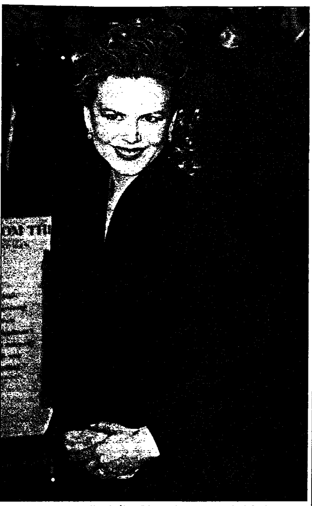
الجمعة نيكل كيومان ظهرت في لندن لحضور حفل العرض الأول لفيلمها الجديد مصورة سيدة